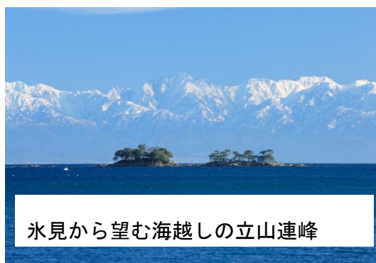
氷見から望む海越しの立山連峰

④ あい鉄 富山 8:40→小杉 8:50→高岡 8:58 着 富山 9:00→小杉 9:10→高岡 9:18 着 J R 氷見線 乗換 高岡発 9:43 →氷見着 10:12