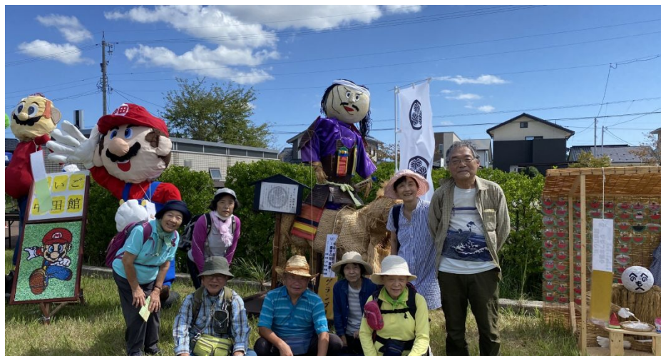
↑ 腫れあがった秋空の下、案山子に囲まれて