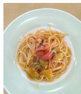
《森田農園のトマト料理》

”弓の清水” ”般若野の古戦場” 宝泉寺の33観音、世相を映す123体のかかしが集合している中田中央公園へ。ランチは、森田農園のレストランの定員が4名までのため、女性陣がトマト料理1時間コースで、「リッチに美味しく」食しました。