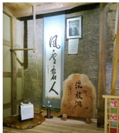
↑ ”混放洞”の遺構 “風雪は人を磨く”の書

ようやく秋の彼岸らしい気温に落ち着いた24日、かかし祭りの中田でウォーキング。先に、北陸自動車初抗地、島田孝之の碑、をめぐり、幕末の私塾”混放洞”の遺構を河合平三の5代目の方から説明してもらった。さらに、常国一里塚、木曾義仲ゆかりの