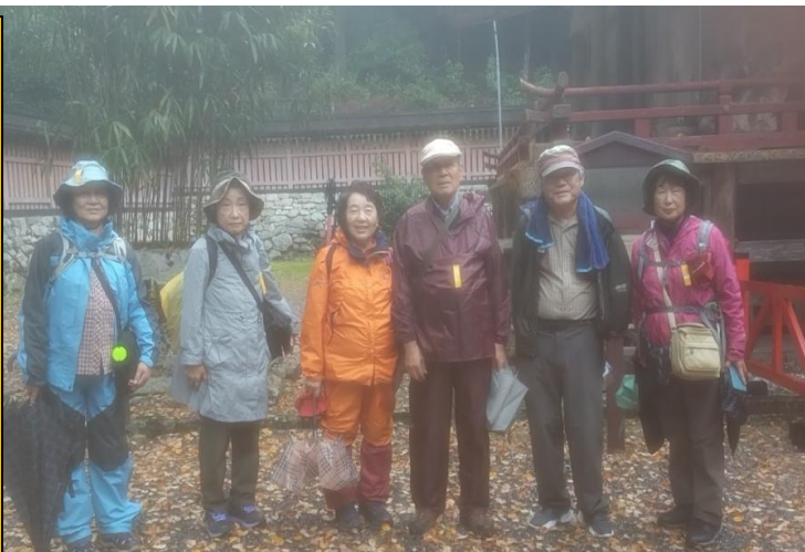
国宝の日吉大社 西本宮本殿前にて