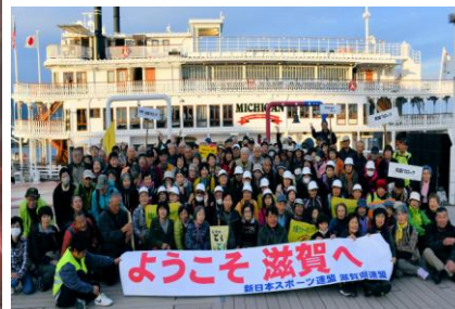
全国交流ウォーク in 滋賀