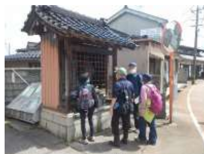
《鍛冶屋橋前の馬頭観音》