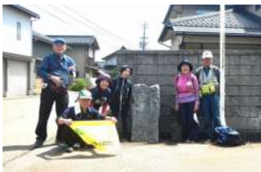
《左いわせ 右とやま の道標》

の折にとりの中沖村の西光寺の本堂を移築したもので寺院建築の様式を残している。別当寺の福王寺の石柱を見て、予定は「本江の道番」の道標だったが、下村コミュニティセンターからバスにて12時30分小杉に帰着した。