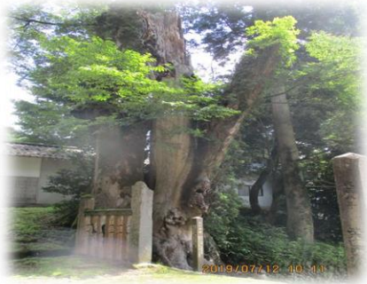
市指定天然記念物 大ケヤキ