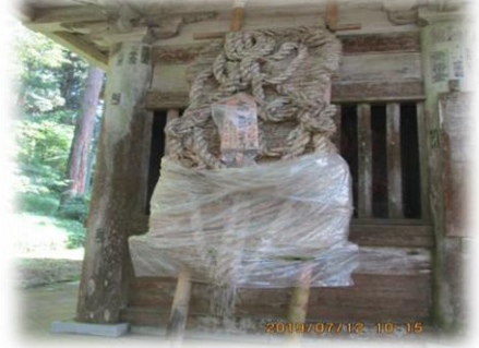
大きなわらじ、なかにはカブよい仁王様がおられる山門