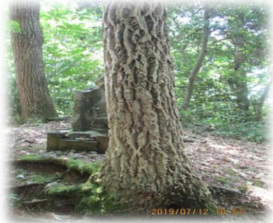
市指定天然記念物 アベマキ林(コルクガシ)