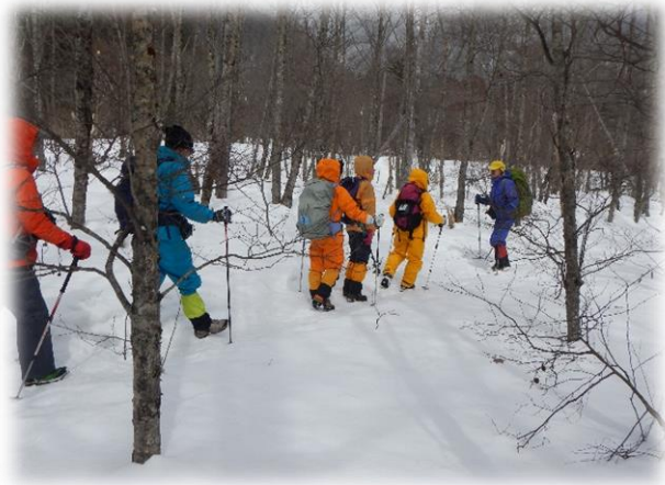
田代池辺りを歩く