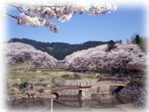
桜の頃の城山公園