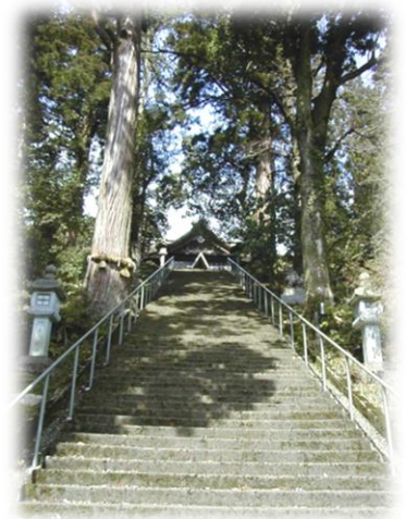
埴生護国八幡宮に続く石段