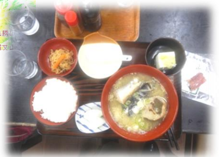
道の駅「市振の関」で食べた「たら汁定食」