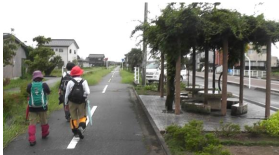
コースの途中こんな素敵な休憩所も

台風の影響の荒天で中止した18日の企画を皆さんに再挑戦の連絡をし、実施しました。