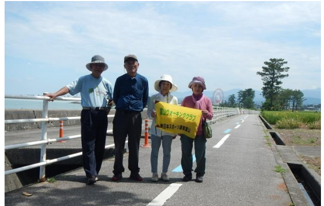
後に消すかに見えるミラージュランドの観覧車をバックに

港を過ぎたあたりで大変疲れを感じましたが、「ゴールでソフトクリームを食べようね」と励まし合い埋没林館のそばへ到着。丁度そばにコンビニがあり涼しい店内でソフトクリームやかき氷を味わいました。