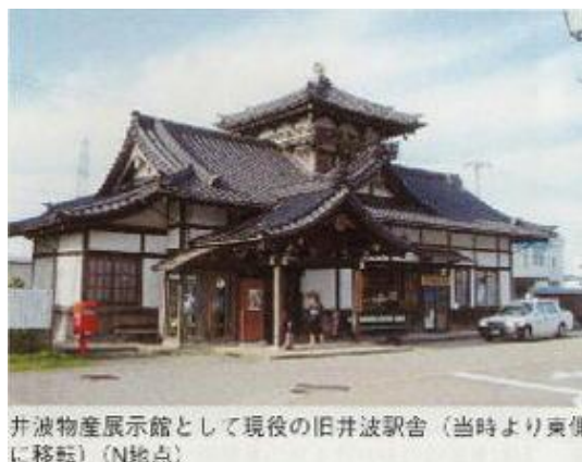
井波物産展示館として現役の旧井波駅舎(当時より東側に移転)(N地点)

石動駅 ⇒ (旧加越線) 南石動跡 ⇒ 四日町 ⇒ 藪波 ⇒ 津沢 ⇒ 本江 ⇒ 野尻 ⇒ 柴田 ⇒ 福野 約12Km (歩行速度2Km/30分)