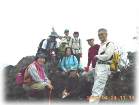
← 獅子ヶ鼻岩で 寺家公園で昼食 →