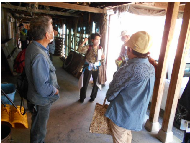
↑ 米騒動の米蔵で説明を受ける

の建物や展示館で写真や文書等の資料の展示を見て、その場所で生まれ育った人から直接に聞く話はとても具体的で納得できた。