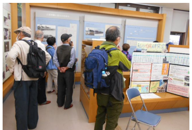
↑ 清流会館での展示コーナー見学

10月13日(木)・14日(金)の2日間、富山市と魚津市を会場にして北陸3県交流ウォーキングが開催されました。2日間とも天候に恵まれて爽やかな秋空の下でウォーキングを楽しみました。1日目は富山市婦中のイタイイタイ病資料館を起点に神通川を渡って清流会館まで歩きました。イタイイタイ病資料館では担当者の説明を聞いた後、イタイイタイ病が発生した大正期中頃から今日までの歴史がパネル展示されているコーナーを見て回りました。