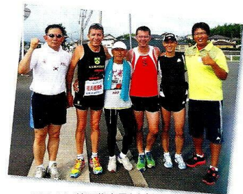
フランス・韓国代表団とともに 広島~長崎反核平和マラソン(2012年)にて

必要事項をメール(zenkoku@njsf.net)、 または下記の申込書をFAX(03-3986-5403)してください。