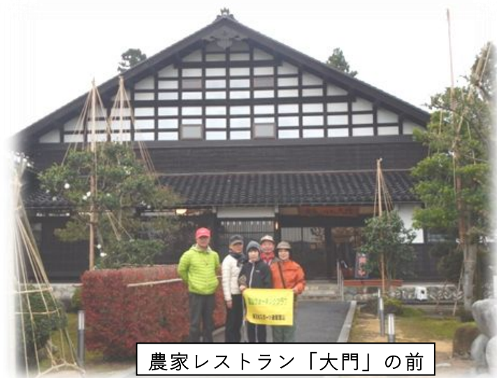
農家レストラン「大門」の前

何で鷹なのか不思議に思って建物の説明版を読んで納得しました。古来砺波地方は鷹栖と呼ばれてい