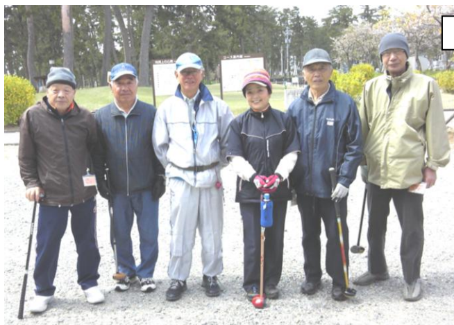
参加された皆さん