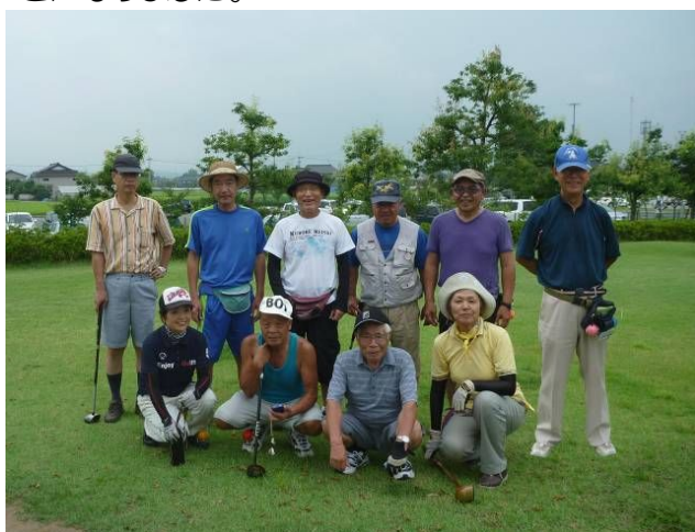
↑ 8月度コンペ参加の皆さん

参加者1名につき100円の東日本大震災の被災者救援募金を拠出し、今日の合計1,000円をスポーツ連盟をとおして、送金いることになりました。