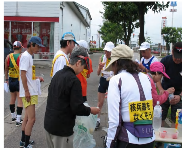
写真: 昨年の反核平和マラソンの給水風景 →