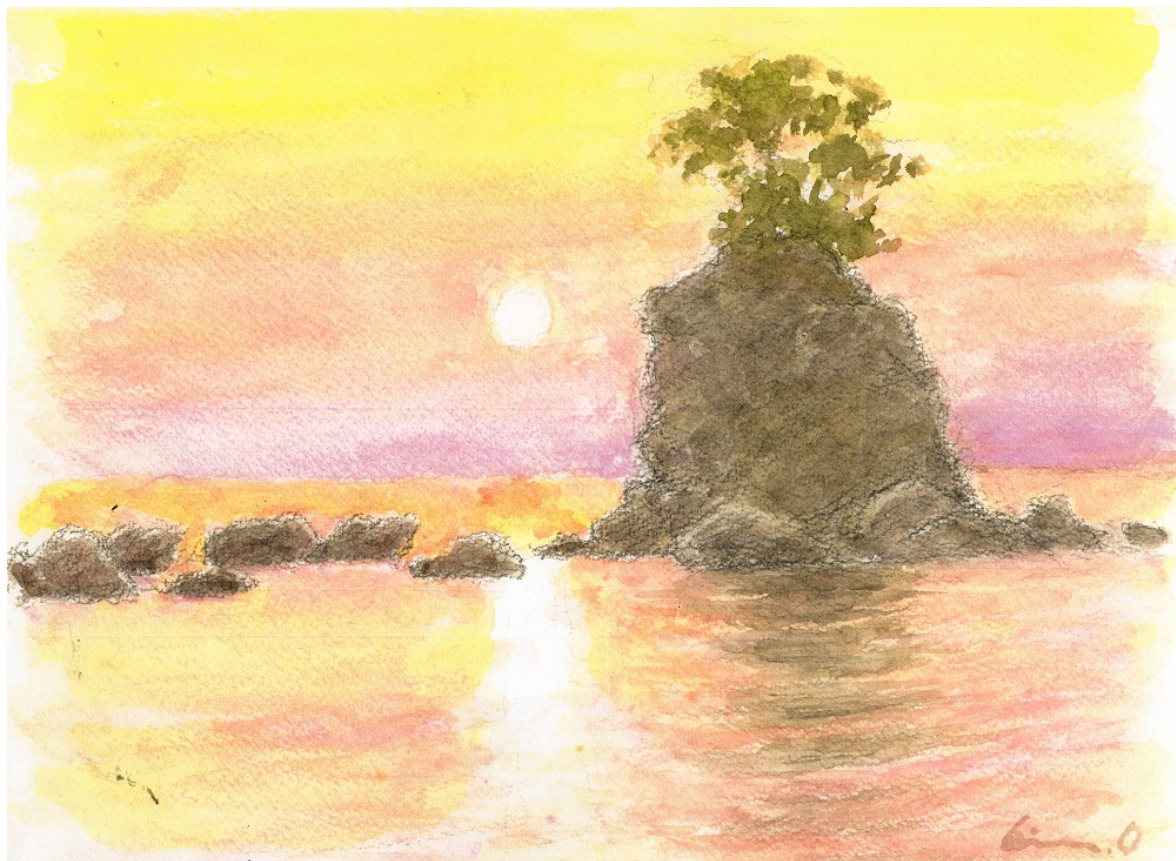
朝陽の雨晴海岸 小木 清 画