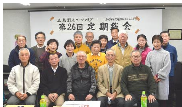
前回の総会スナップ