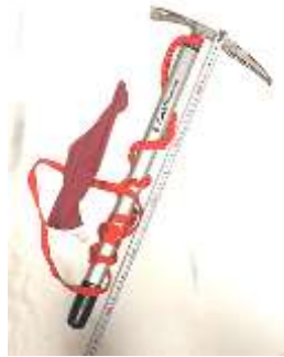
ブラックダイヤモンド製 長さ 55 cm 短めです (新品価格は 14,850 円)