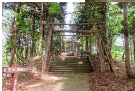
上・1 から 9 合目 の標識設置