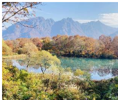
白池 と背景 の海山山塊